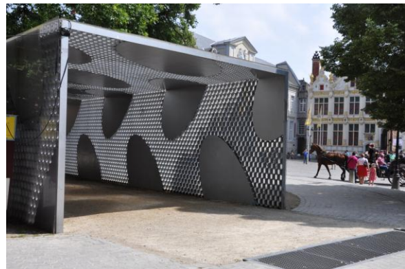
Augustus 2013.