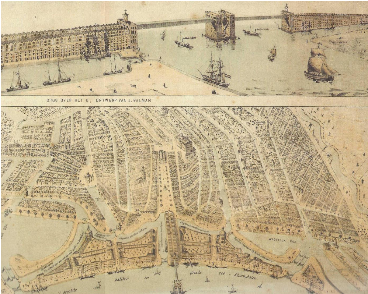
Amsterdam en brug over het IJ, ontwerp J. Calman, 1857

geërfd, het goede zowel als het kwade – en vergissingen hebben een land leven”. Vroeger sprak men van “bouwmeesters” maar wij kennen ook het woord “mismeesteren”. Nooteboom gaat uitvoerig in op de periode rond 1900 met Berlage, De Bazel, Lauweriks en anderen. In een ontwerp kan een architect vertrekken van een utopische insteek, zoals Wijdeveld. Het is de verbeelding aan de macht.