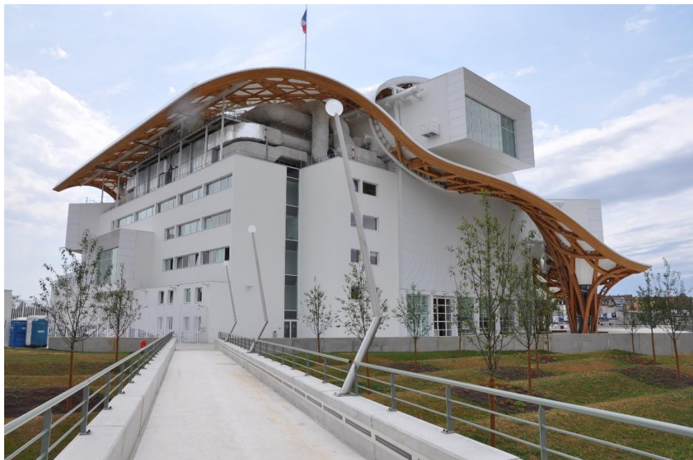
Voor en achterzijde in Metz