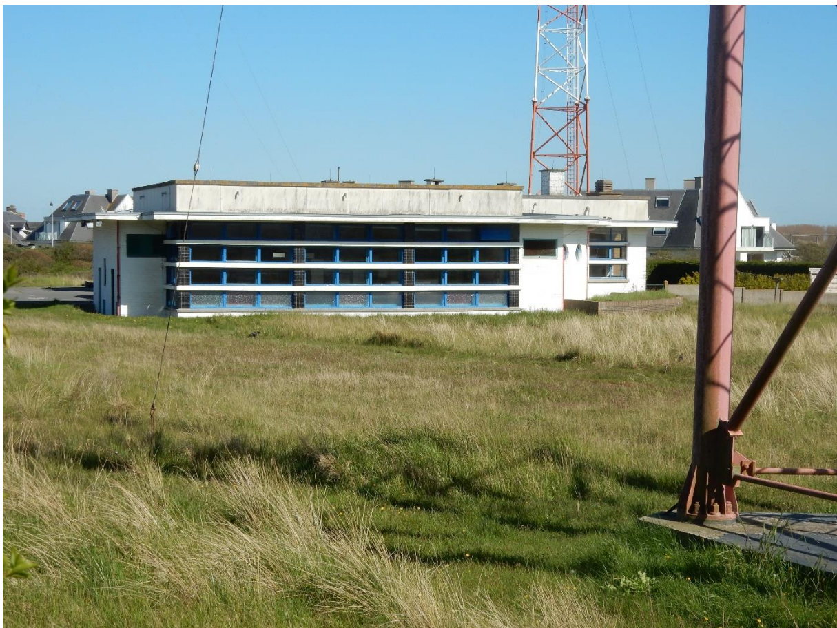
Middelkerke ex RTT gebouw foto Marc Dubois 2019

Samen met het zendstation in Ruislede (Wingene) en het ontvangststation in Oudenburg was dit gebouw de infrastructuur van de Radio Martieme Diensten, een onderdeel van de RTT. In 1938-1939 werden twee 65 meters hoge zendmasten opgetrokken evenals een bescheiden gebouwtje. De naam van de architect is onbekend, vermoedelijk iemand die binnen de RTT werkzaam was.