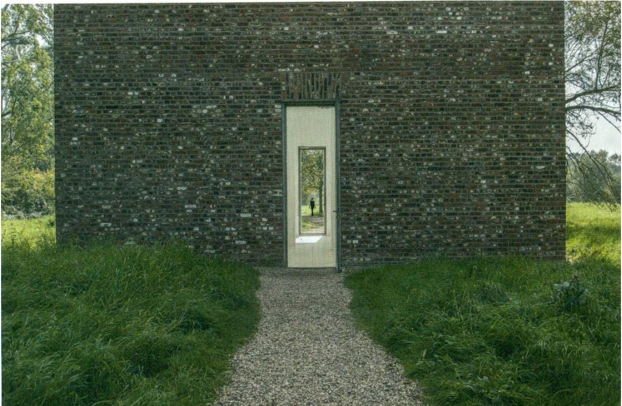
Museum Insel-Hombroich in Neuss (11 oktober 2014).