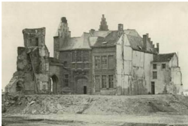
Dit was eens Het Steen

Het bureau noAarchitecten heeft een stevige reputatie opgebouwd met wel overwogen ingrepen in een historische context. In Hasselt werd een oude gevangenis geïntegreerd in een universitair complex. In het West-Vlaamse Lo werd op een zeer tactiele wijze het gemeentehuis uitgebreid. Vergeten wij niet de renovatie van het stadhuis in Menen en de transformatie van het stadhuis in Kortrijk. Het Gruuthusemuseum in Brugge kreeg een hedendaags inkompaviljoen en in Aarschot zijn de Hertogenmolens een internationaal gewaardeerd voorbeeld van het samengaan van een historisch bouwvolume met een nieuwbouw. Zelfs in Antwerpen toonde noA architecten hun inlevingsvermogen om oud en nieuw naast elkaar te plaatsen. De verbouwing van het Museum Plantin-Moretus is voorbeeldig, een attitude om niet te bruuskeren, een toevoeging om een eigen autonomie te geven zonder te overweldigen. Verwacht van hen geen spectaculaire architectuur zoals het exhibitionistisch vertoon van Zaha Hadid met haar Antwerps Havenhuis. Een Hadid architectuur naast 't Steen van Antwerpen zou getuigen van een miskennis van de complexe gelaagdheid van deze historische site.