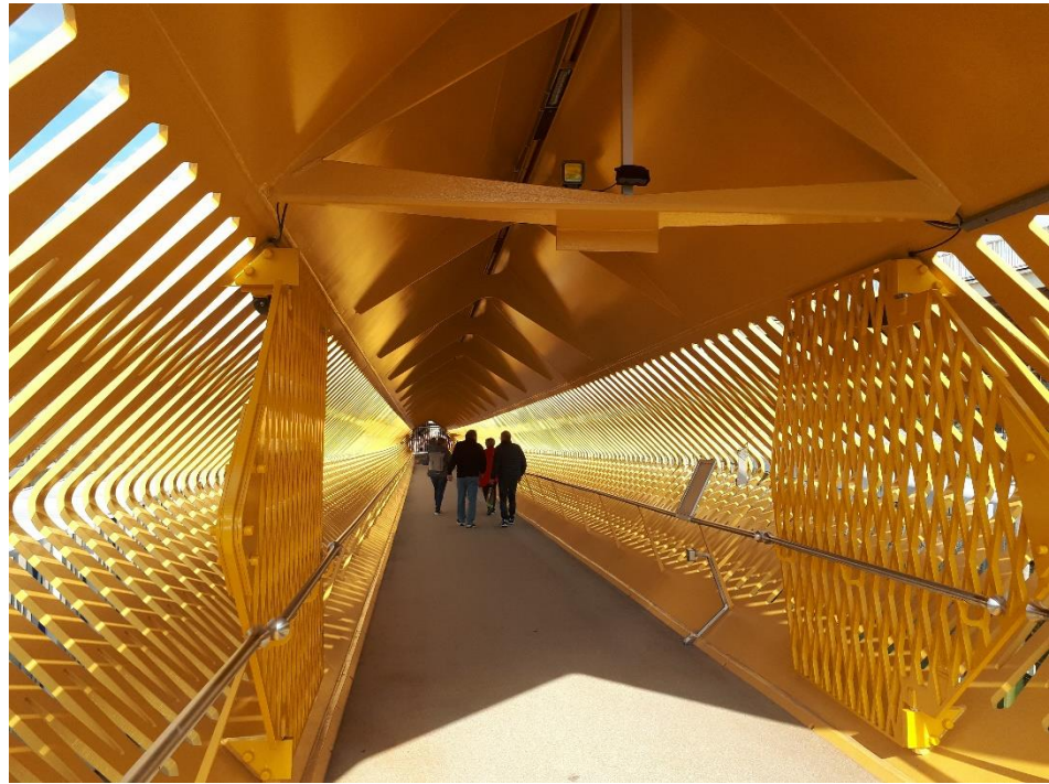
Terminal aan Het Steen Ontwerp Ney & Partners

Vlamingen, mogen goed worden ontvangen in een gebouw waar op een didactische wijze de geschiedenis van de stad en de Schelde wordt gepresenteerd aan een ruim publiek. In de media werd de nieuwbouw voorgesteld als uitsluitend een cruiseterminal, wat onjuist is. In het gebouw is er een stadswinkel en een ruistruimte met zicht op de Schelde. Toeristen vinden er een belevingsparcours met de geschiedenis en de highlights van de stad.