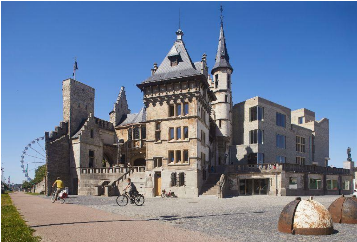
Persmededeling