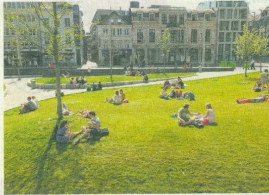
Even uitblazen op The Green aan de stadshal maakt mensen gelukkig.

In De Streekkrant van 12 juni stond een artikel "The Green maakt gelukkig" en dit naar aanleiding van een studie dat groen een belangrijke factor is in de stedelijke omgeving. Daarbij een foto van de groene omgeving rond de nieuwe stadshal die bij zonnig weer intens in bezit wordt genomen.