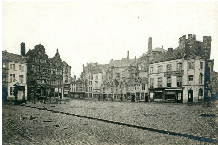
Veerleplein en Gravenkasteel voor de restauratie. Het Veerleplein dat een vierde gevelrei.

Is het Y bouwvolume met twee bouwlagen "de" oplossing om nog meer toeristen te ontvangen? Wie de oude foto's bekijkt stelt vast dat in de 19de eeuw enkel het toegangsvolume van het kasteel zichtbaar was, het werd de toegangspoort tot de fabriek. Links en rechts waren er gebouwen opgetrokken tegen de middeleeuwse muur. Het Veerlepleintje had met haar vier gevelwanden een intieme sfeer en na de restauratie ontstond een totaal andere verhouding op dit plein. De vraag kan men stellen waarom de architecten niet deze "restruimte" hebben aangewend in plaats van het weinige groen dat overblijft te elimineren. Op deze percelen stonden in de loop der eeuwen wel constructies maar die moesten verdwijnen om het Gavensteen een grotere nationale uitstraling te geven. Deze optie werd niet eens onderzocht.