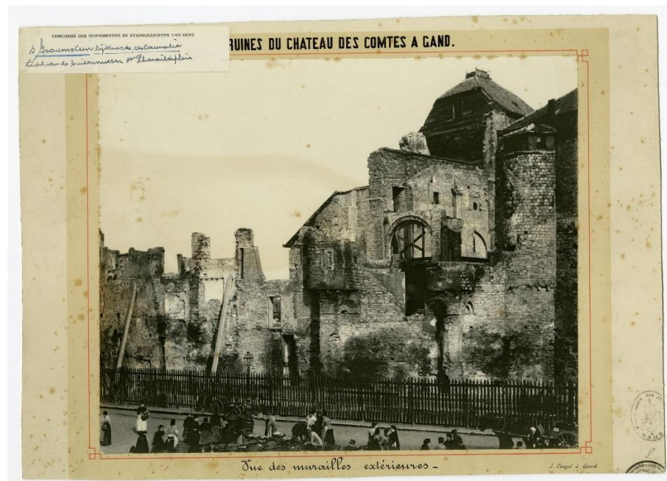
Gent Gravenkasteel tijdens de restauratie

deze fase in het leven van het Gravenkasteel werden wegenomen. De indrukwekkende foto's die het stadsarchief bezit tonen een bouwwerf waar