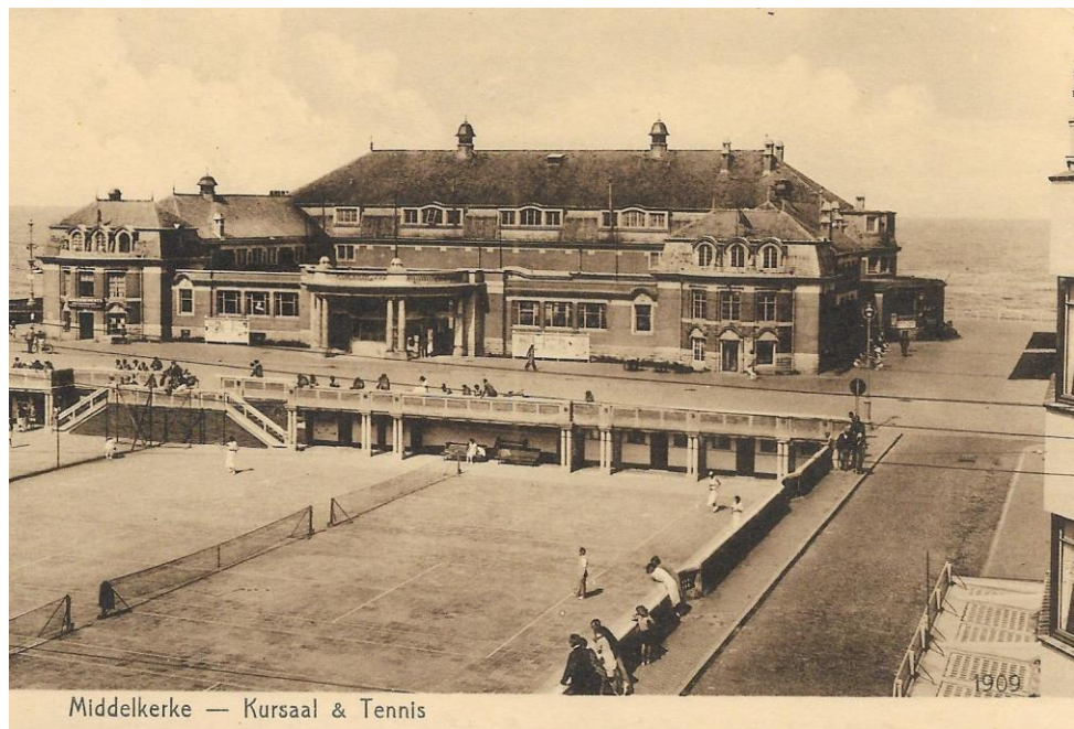
Middelkerke — Kursaal & Tennis

Oostende Yacht Club