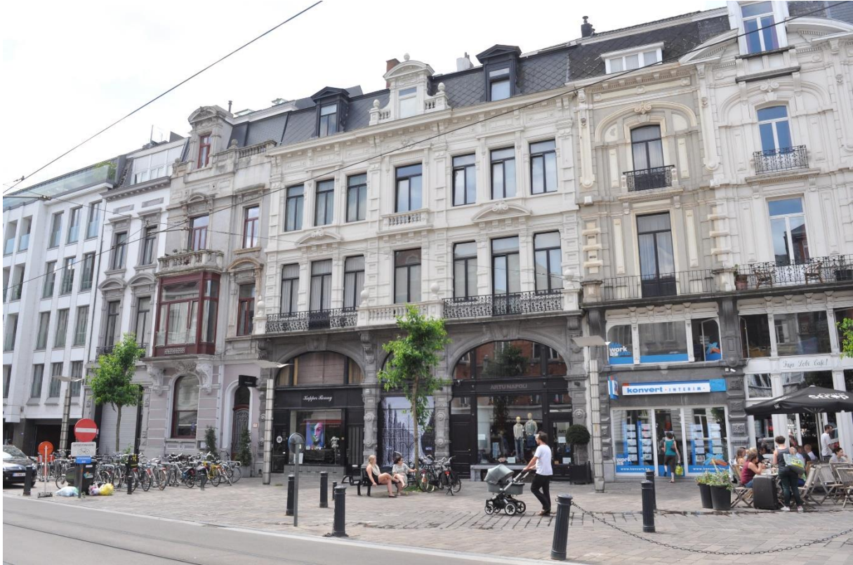
Gent Vlaanderenstraat westzijde met links het appartementsgebouw uit de jaren '70

De vraag is of na het slopen van de "rotte tand", de nieuwbouw wel de juiste "vulling" zal zijn om in tandheelkundige termen te blijven.