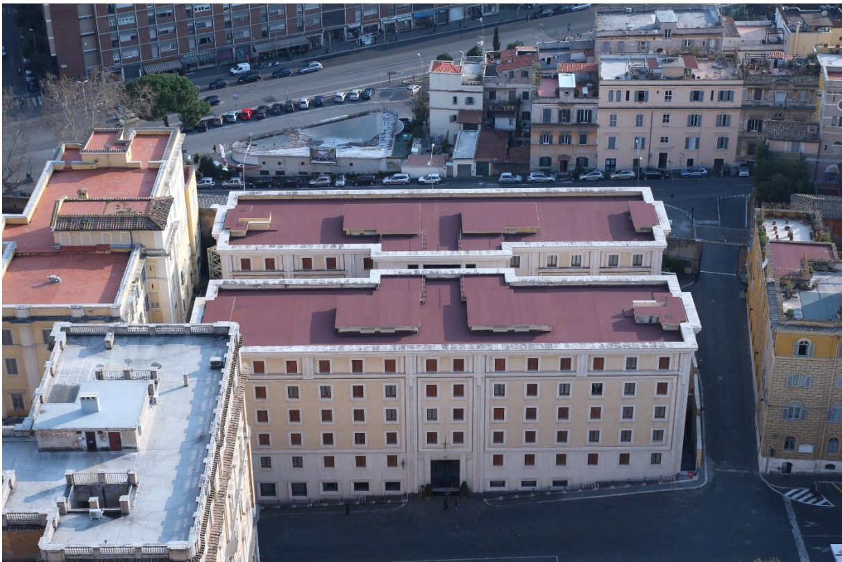
H-vormig en vijf verdiepingen hoog gebouw. De straat daarachter is Via della Stazione Vaticana. Vanaf deze site hadden de Romeinen en de toeristen een zicht op de wonderlijke koepel van Michelangelo.

Op 5 april 1995 publiceerde KNACK mijn artikel met als titel "Cristo pakt het Vatikaan" met een knipoog naar het inpakken van het "Huis van de Heilige Martha" om de nieuwe gevel te verstoppen voor fotografen. Ik kreeg toen een reactie vanuit het Aartsbisdom Mechelen met de vraag of mijn info wel correct was.