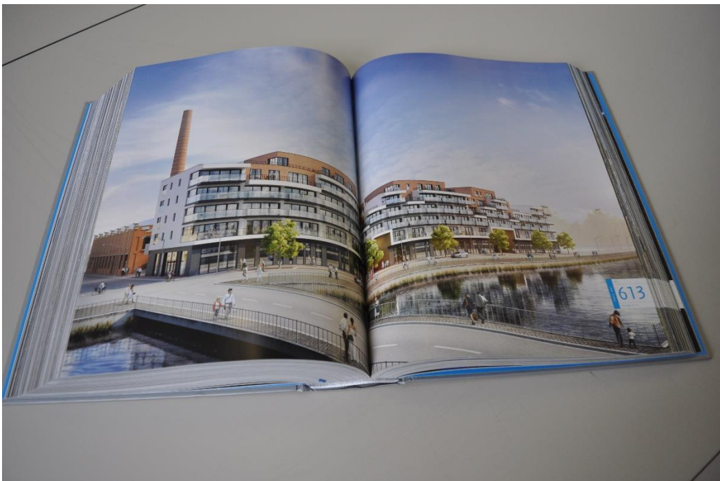
Tribeca project aan de Nieuwevaart met ongeveer 200 wooneenheden voor Ghelamco