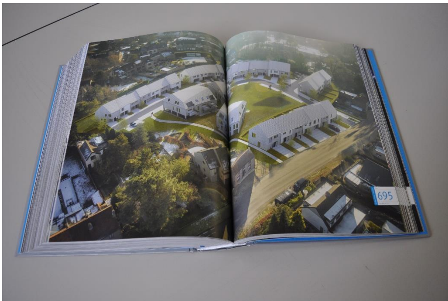
Een banale verkaveling in Lokeren "Reinaertpark".

Het bureau Bontinck is een professioneel gerund bedrijf met als eerste ambitie een zo groot mogelijk marktaandeel te bekomen. Generatie na generatie is het bureau er in geslaagd om via directe opdrachten hun positie te behouden in Gent. In dit overzicht zijn er wel een aantal projecten die te vermelden waard zijn, gebouwen die bijdragen aan de omgeving of de herwaardering van een site zoals het project Reylof in de Hoogstraat, de renovatie van de Oude Vismijn en het OCMW gebouw in Ledeberg. Er zijn ook zeer zwake voorstellen zoals het Reinaertpark in Lokeren, een banale verkaveling die men in Vlaanderen zou moeten verbieden. Terwijl de overheid pleit voor verdichting en voor een ecologische benadering met de beschikbare gronden worden onverantwoorde projecten nog steeds getekend (woord ontwerpen komt hier niet van pas) en goedgekeurd door stadsbesturen.