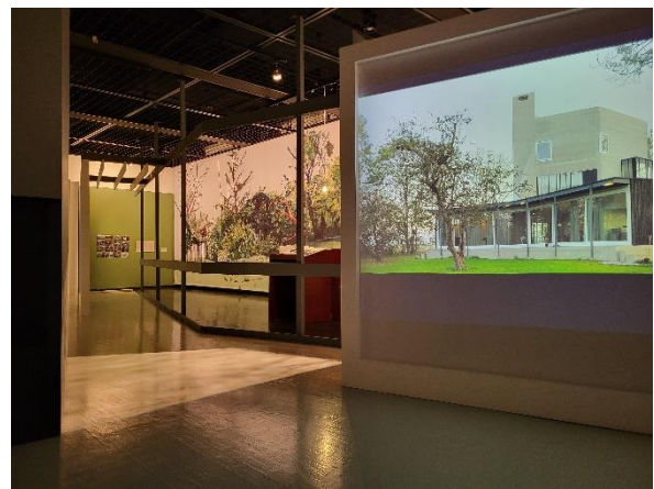
Helsinki 6 & 7 februari 2025

Zoals in haar presentatie in deSingel /VAI staat het idee van het scheppen van een sfeer in de woning centraal. Een bewuste keuze om het uiterst belang van het wonen te bedrukken, het maken van een "binnen" met juiste verhoudingen en stilte om in deze intense wereld tot rust te komen.